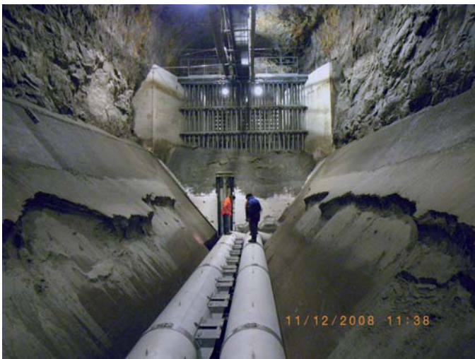
Bild 3. Liegen gebliebener Sand nach erfolgter Spülung und Absenkung des Beckens.