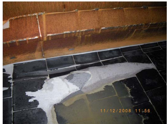
Bild 4. massiver Verschleiss an aufwändiger Basaltpanzerung.

des Sandes in der ersten Zeit ausgetragen wird. Ca. 85% des Sandes werden in den ersten 17 Sekunden ausgetragen (bis das Spülrohr nur noch sauberes Wasser führt → entspricht einer Spülung ohne Absenken). Am Anfang ist die Sandkonzentration im Wasser jedoch noch höher. Daraus lässt sich schliessen, dass nach ca. \frac{2}{3} dieser Zeit insgesamt mehr als 75% (90% von 85%) des Sandes ausgetragen wurden.