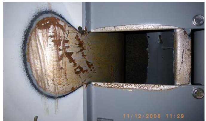
Bild 5. Verschleiss des Korrosionsschutzes am Abzugrohr System HSR.